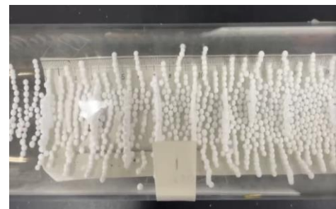
右 音の大きさ 4