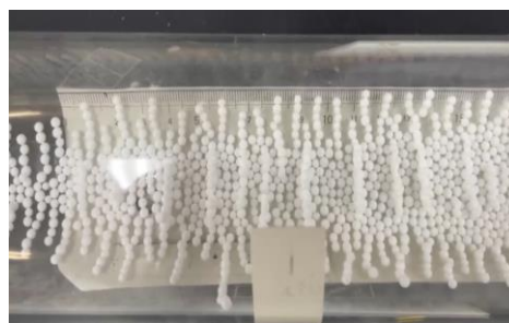
左 音の大きさ 2